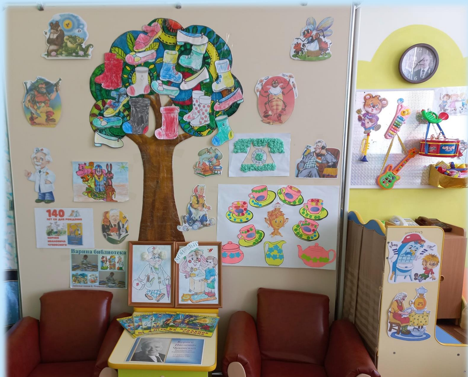
Совместное оформление центра чтения и книги к юбилею К.Чуковского