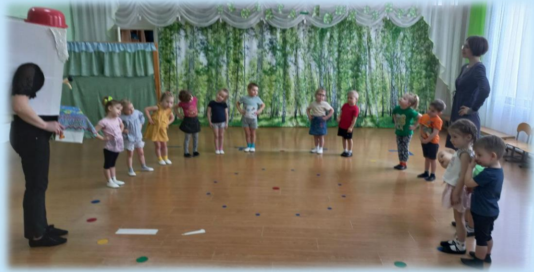
Развлечение «В гостях у Мойдодыра»