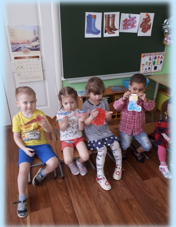
Коллективная работа «Чудо Дерево»