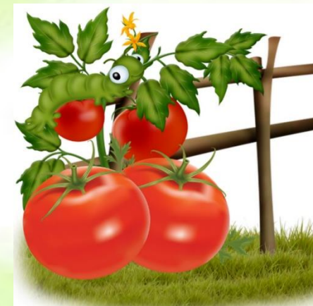
Дидактическая игра «Что растет на грядке, на кусте, на дереве?»