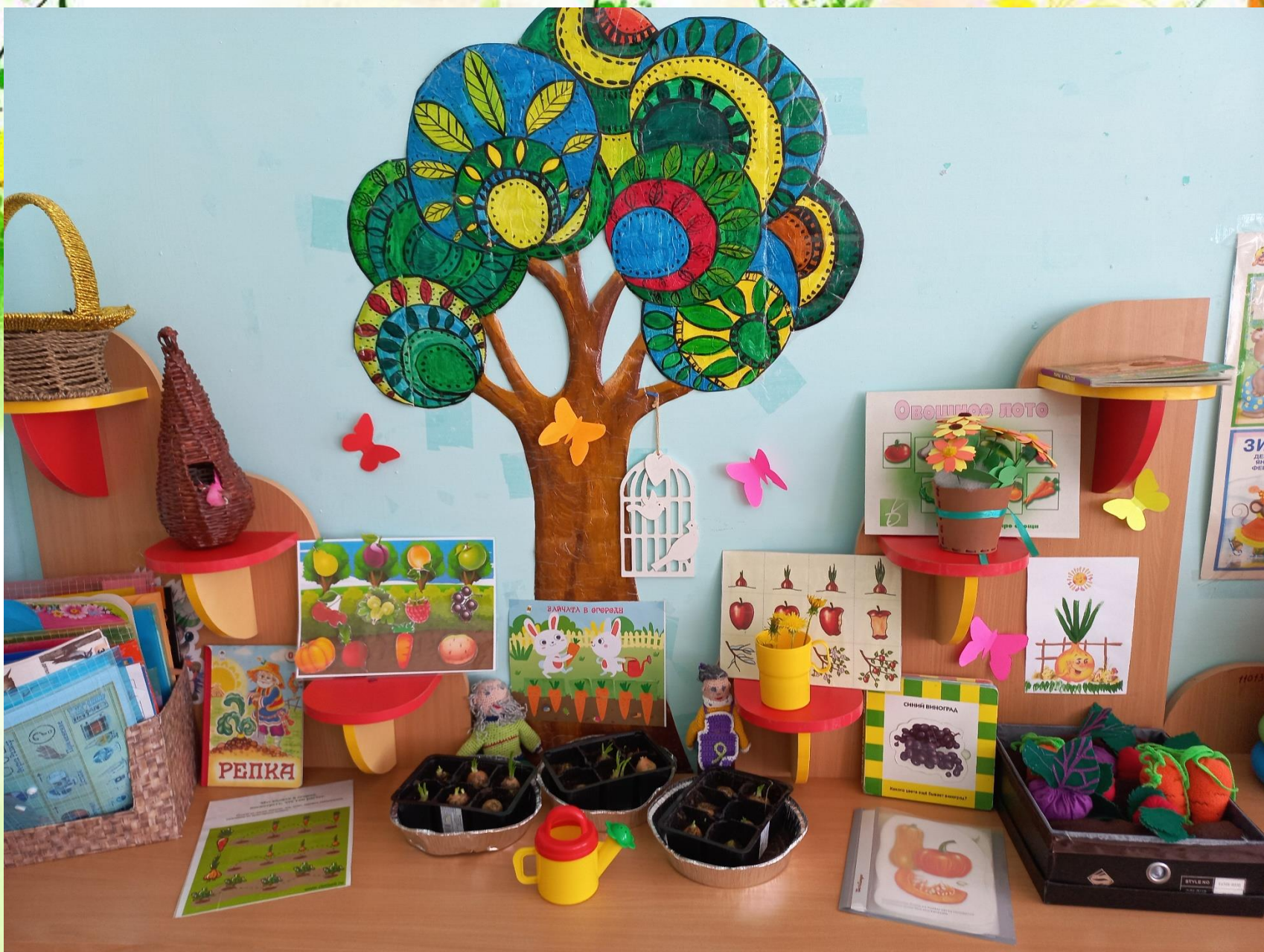
Вот и наш огород